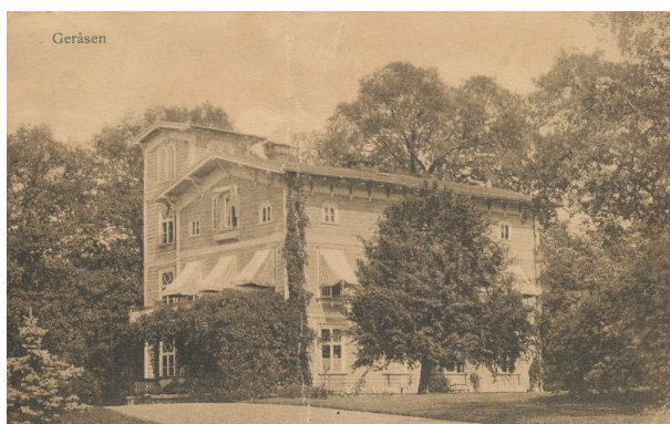
Ovan: Geråsen på Harriet Löwenhjelmns tid, tidigt 1900-tal Till höger: Geråsen i juni 2018