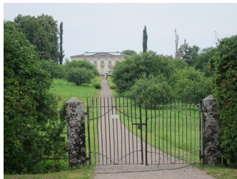
ULFÅSA SLOTT på vykort från 1905 samt slottet med trädgård i juli 2013.