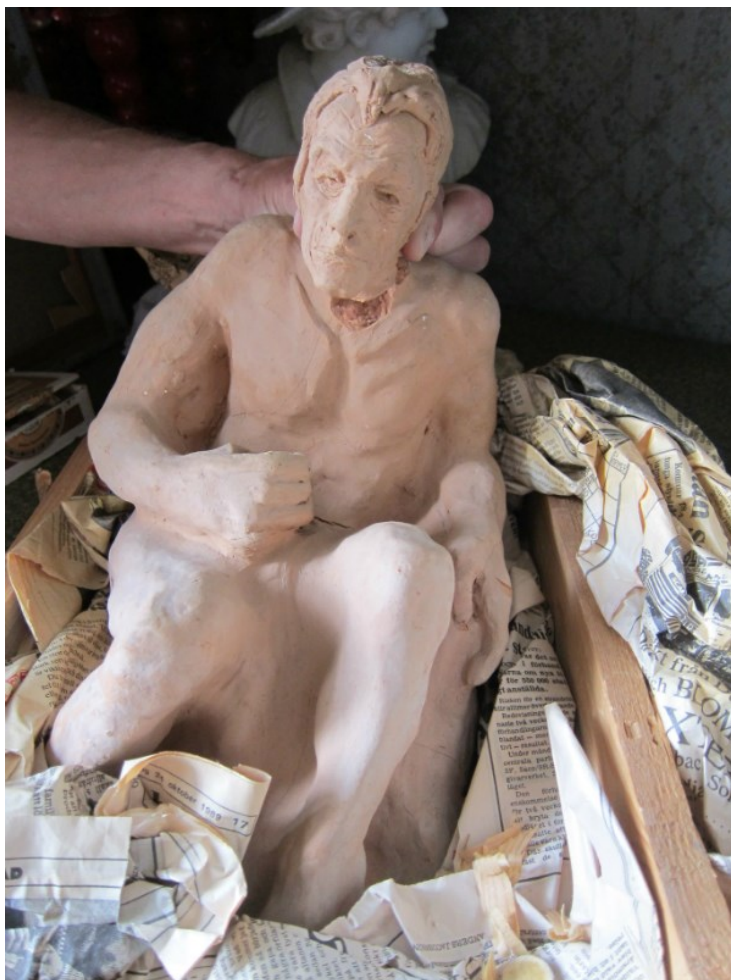
LERSKULPTUR av Harriet Löwenhjelm på Ulfåsa slott. Vid fototillfället i juli 2013 förvarades skulpturen i en trälåda med tidningspapper från den 24 oktober 1989.